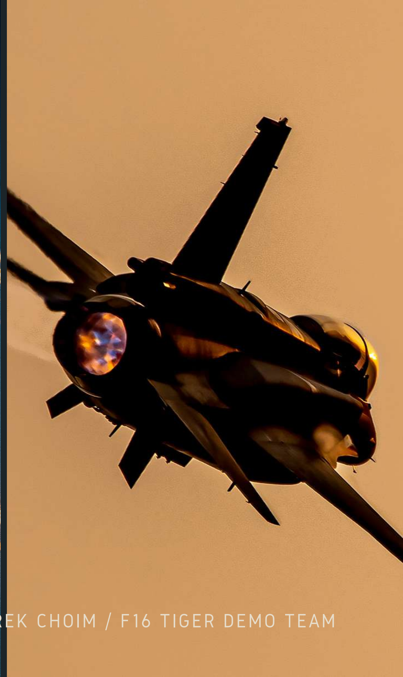
AH-1 COBRA / MAREK CHOIM / F16 TIGER DEMO TEAM