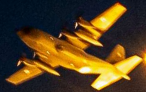
WYRZUT FLAR Z C130 HERCULES